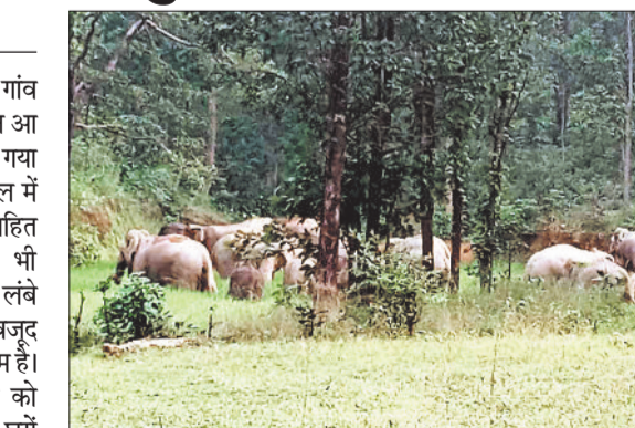
जंगल में हाथियों का दल।

नगर पंचायत प्रतापपुर क्षेत्र के सीमावर्ती गांव करंजवार जंगल में 30 हाथियों का दल आ जाने से क्षेत्र के ग्रामीणों में हड़कंप मच गया है। हाथियों के दल में नर मादा सहित शावक हाथी भी शामिल है। क्षेत्र लंबे समय से हाथियों के सक्रिय होने के बावजूद वन विभाग हाथी को भगा पाने में नाकाम है। हाथी ने सिर्फ खेतों में लगी फसल को नुकसान पहुंचा रहे है बल्कि लोगों के घरों को तोड़फोड़ कर क्षतिग्रस्त हो रहे है। 30 जंगली हाथी के आ जाने से जहां ग्रामीण अपने आप को असुरक्षित महसूस कर रहे हैं वहीं भय के साये में जीवन व्यतीत कर रहे हैं।