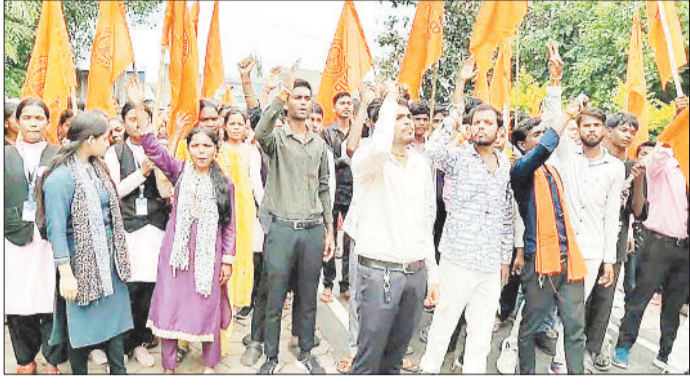
महाविद्यालय के सामने प्रदर्शन करते अभाविप कार्यकर्ता व विद्यार्थी।